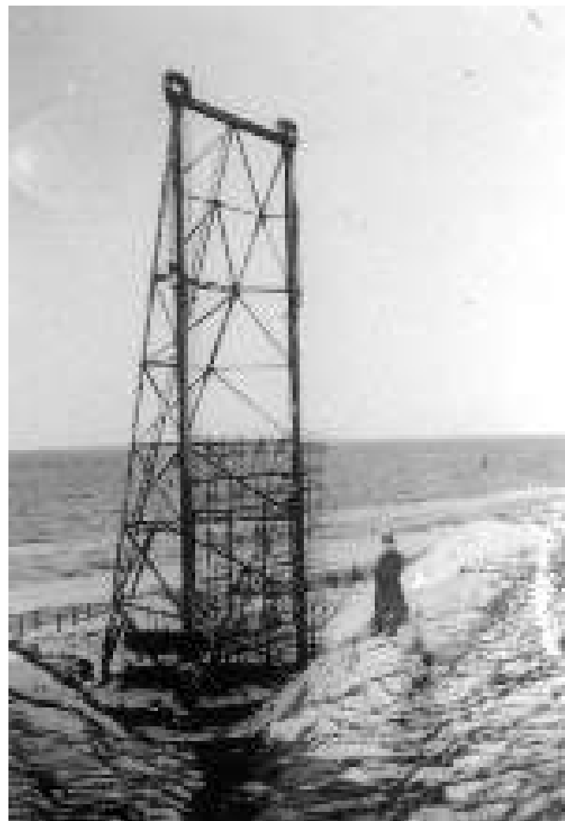
Radare af typen "Fahrstuhl-Freya" fotograferet ved Nørre Lyngby nord for Løkken i 1945.

Den militære efterretningstjeneste, "Stockholmarkivet": pk. C, CXIII.